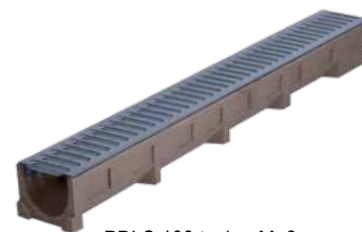
PDLs 100 techn. Maße