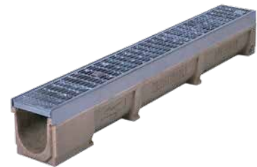
PDG techn. Maße

* mit werkseitig eingegossenem PVC-Stutzen DN 110