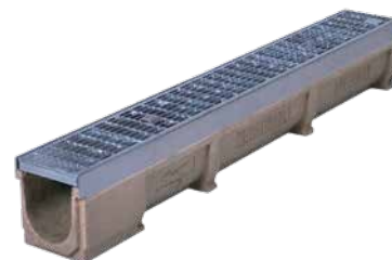
PDG techn. Maße

* mit werkseitig eingegossenem PVC-Stutzen DN 110