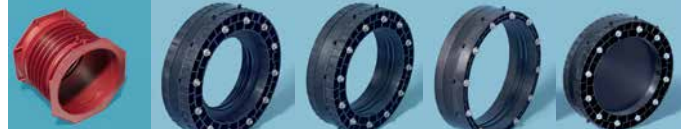
RDS1034EV RDS1016EV RDS1017EV RDS1018EV RDS1022EV