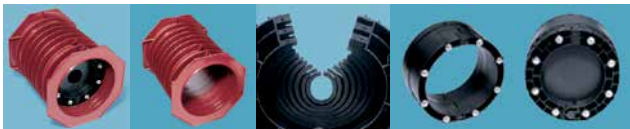
RDS1041EV RDS1031EV RDS1012EV RDS1013EV RDS1021EV