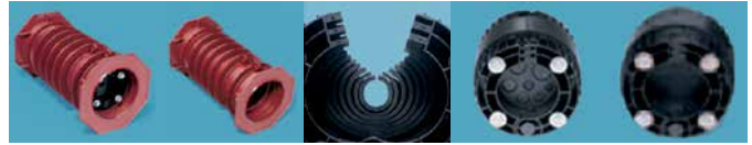
RDS1046EV RDS1036EV RDS1024EV RDS1023EV RDS1027EV

für Mediumrohre DA 8 - 90 mm (erweiterbar nach unten bis DA 160 mm)