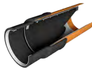
Einbau am Rohrende: