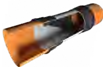
Einbau in Rohrleitung: